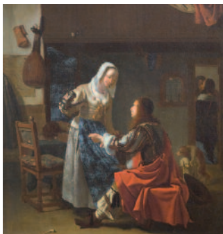
Frans I. van Mieris - kopie: Námluvy , (po 1659), Národní galerie v Praze