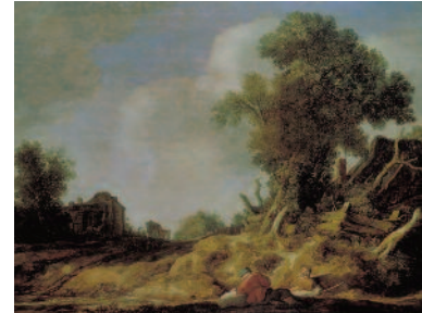
Pieter de Molijn: Venkovská cesta s odpočívajícími poutníky , 1628, Národní galerie v Praze