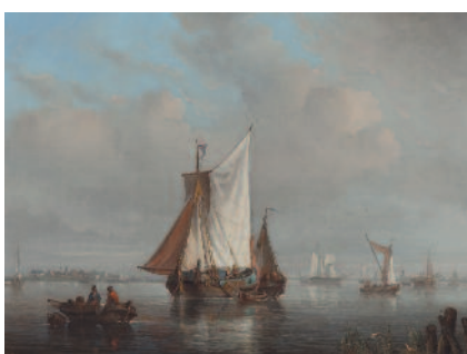
Egidius Linnig: Řeka Šelda , 1848, Rademakersova sbírka