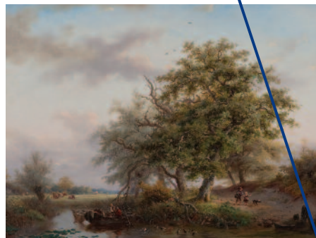
Fredrik Marinus Kruseman: Letní krajina s člunem na jezeře , 1860, Rademakersova sbírka