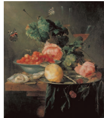
Jan Davidsz de Heem: Zátíší s ovocem , 1652, Národní galerie v Praze