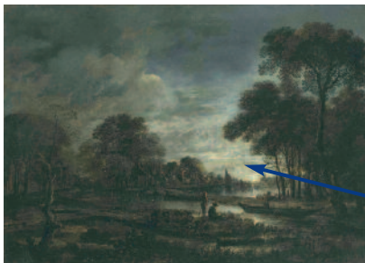
Aert van der Neer: Holandská vesnice při východu měsíce , 17. století, Národní galerie v Praze