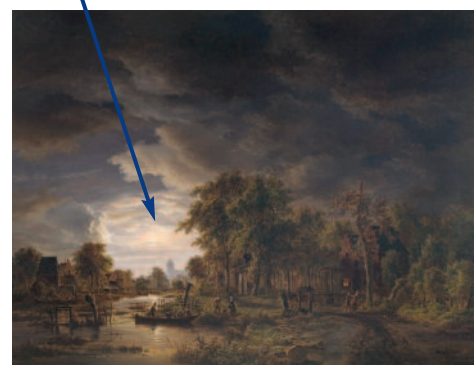
Jacob Abels: Vesnice u řeky ve svitu měsíce , 19. století, Rademakersova sbírka