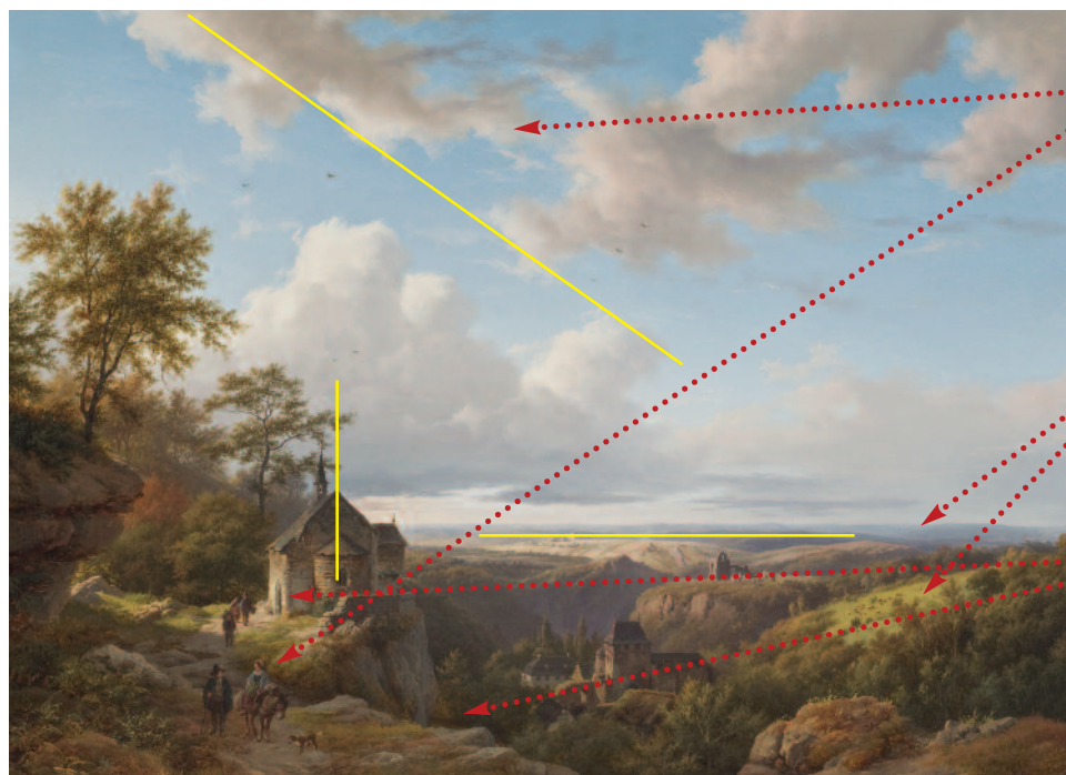
Barend Cornelis Koekkoek: Krajina v Eifelu s kostelíkem , 1845, Rademakersova sbírka

využití barevné perspektivy a střídání osvětlených a tmavých částí krajiny