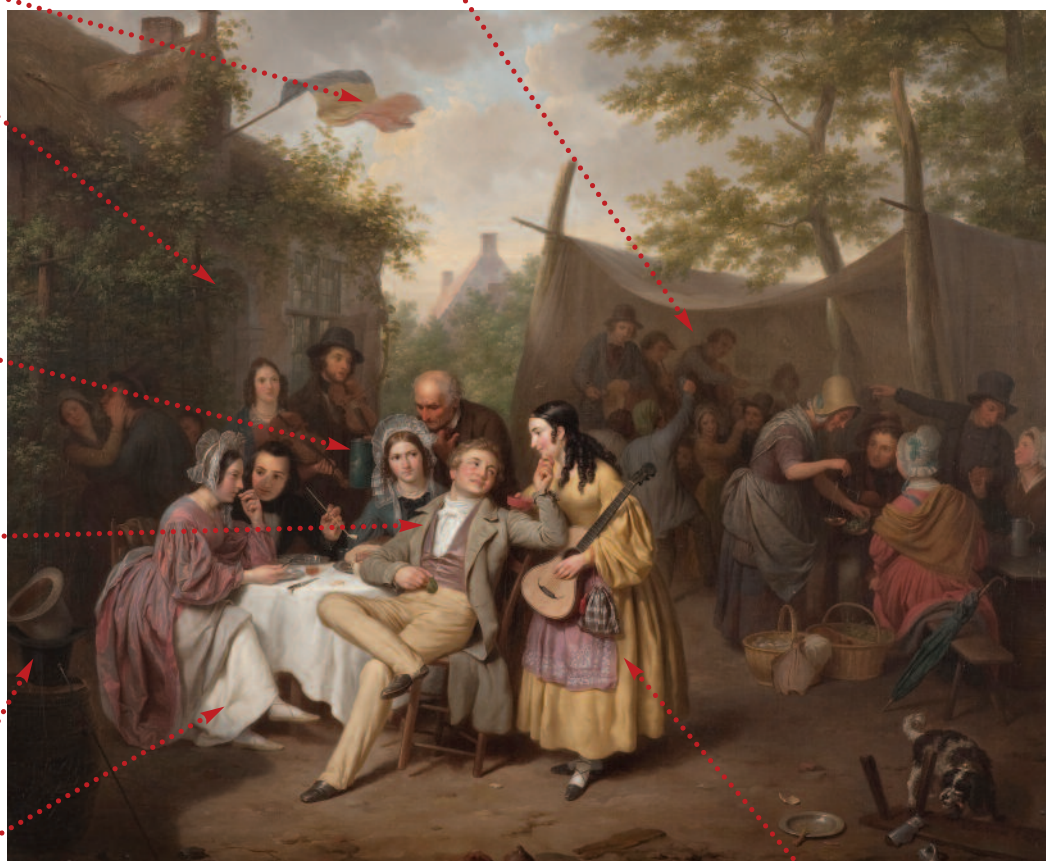
Basile de Loose: Vesnická zábava , 1838, Rademakersova sbírka

příjemné až lehce líbivé barvy citace starých holandských mistrů