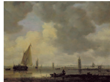
Jan van Goyen: Lodě v ústí řeky , 1646, Národní galerie v Praze