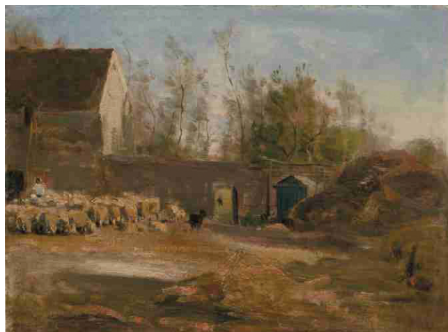
Ovce před dvorcem, 1866, olej, plátno, 30 x 42 cm

Vraťte se studenty k tématu motivace a položte jim otázku, které krajiny by nyní daly přednost? Jak moc se krajiny z 19. století propojily s vaší představou oblíbené krajiny? Jaké hodnoty a prvky sledujete v krajině vy a jaké 19. století? Změnil se nyní váš názor na krajinu 19. století?