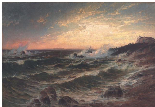
Ztroskotání lodi, 1873, olej, plátno, 88 x 131 cm

Projděte si výstavu a zastavte se postupně u těchto obrazů: Večerní krajina s lovcem (1858) , Kaple racků na ostrově Sark (1868) , Ztroskotání lodi (1873) . Prozkoumejte, jakým způsobem jsou tu zachyceny všechny čtyři živly. Zkuste si představit, že stojíte v krajině a můžete jednotlivé živly vnímat přímo, nejen zrakem, ale i hmatem, čichem, celým tělem. Jaké by byly Vaše vjemy?