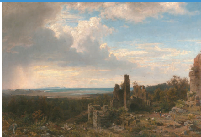
Krajina se zříceninou v pohoří Rhön, 1860, olej, plátno, 108 x 158 cm

Riedel jako jeden z prvních našich umělců si uvědomil význam francouzské krajinomalby pro další vývoj umění. Jeho bezprostřední kontakt s druhou generací barbizonských malířů a transformace jejich podnětů do osobitého, koloristicky neobyčejně bohatého výrazu, znamenala pro českou malbu první skutečný dotek s francouzským krajinářským realismem. Jeho realistická koncepce, ovlivněná čelnými představiteli