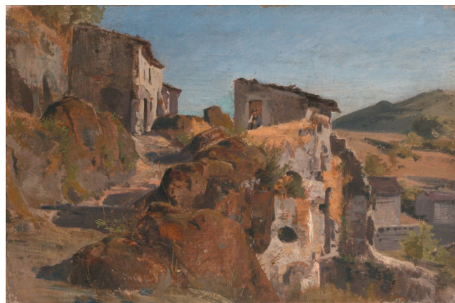
Jižní krajina s domy, 1862, olej, plátno, 29,5 x 45 cm

Riedelovo dílo je spojnicí mezi romantickými krajinami Adolfa Kosárka a realistickou krajinomalbou Antonína Chittussiho. Jeho neteř Hermína Laukotová (1853 - 1931) se také stává malířkou.