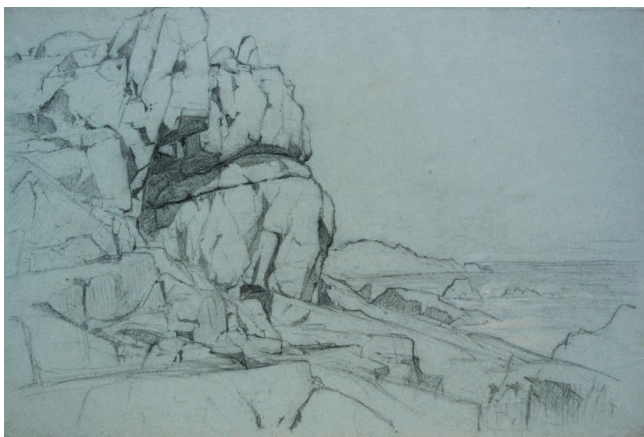
Rozeklaná skála u moře, 1867, tužka, papír zelený, 31,5 x 47 cm

Zaměřte se při prohlídce na ty obrazy a jejich části, které zachycují skalnatá pobřeží. Pozorně si prohlédněte strukturu skal i způsob malby. Vezměte si obyčejný papír formátu A3 a z jedné strany ho mírně zmuchlejte. Znovu papír rozbalte a černým fixem obtáhněte vybrané linie (některé části detailněji). Jednoduchou linií můžete vytvořit horizont (mořská hladina). Vznikne tak kresba skalnatého pobřeží u moře. Své kresby porovnejte mezi sebou a srovnajte je se studijními kresbami W. Riedela (např. Rozeklaná skála u moře, 1867 ). Podařilo se vám vytvořit plasticky působivou kresbu? Jaký tvar a dynamiku má vaše pobřeží?