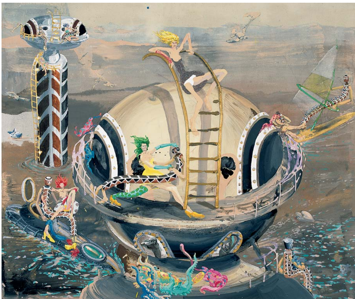
Tanec s domorodci, 2006, akryl, plátno, 150x180 cm

„Pro mě je závěsný obraz důvodem, proč se zabývám výtvarným uměním. Kdyby závěsný obraz neexistoval a výtvarné umění se odvíjelo výhradně v nových formách, jako konceptuální umění nebo umění nezobrazující, které se nevyjadřuje prostředky závěsného obrazu, tak bych výtvarné umění nedělal. Výtvarné umění mě zajímá právě kvůli obrazům. To už jsem si tisíckrát vyzkoušel, ty různé „odbočky“. Královská disciplína pro mne a můj temperament je prostě závěsný obraz. Protože je to klasické médium, o jeho podstatě se vlastně nepochybuje, ale současná doba