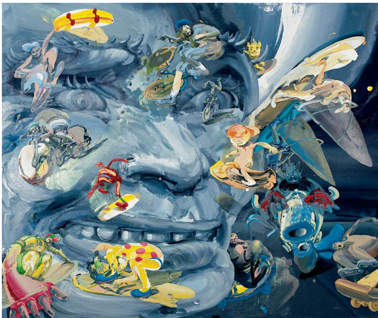
Vítězný úsměv, 2006, akryl, plátno, 190x230 cm

Často vystavujete v cizině. Jaký je zahraniční divák? „Odpověď je trochu složitější. Dějiny umění byly napsány bez Čechů. Informovaný divák „venku“ vás nemá kam zařadit. V 80. letech jsem se dostal do Basileje. Lidé co tam chodili říkali: „To je přesně in“. A kdybych byl tehdy na Západě, tak bych vytvářel