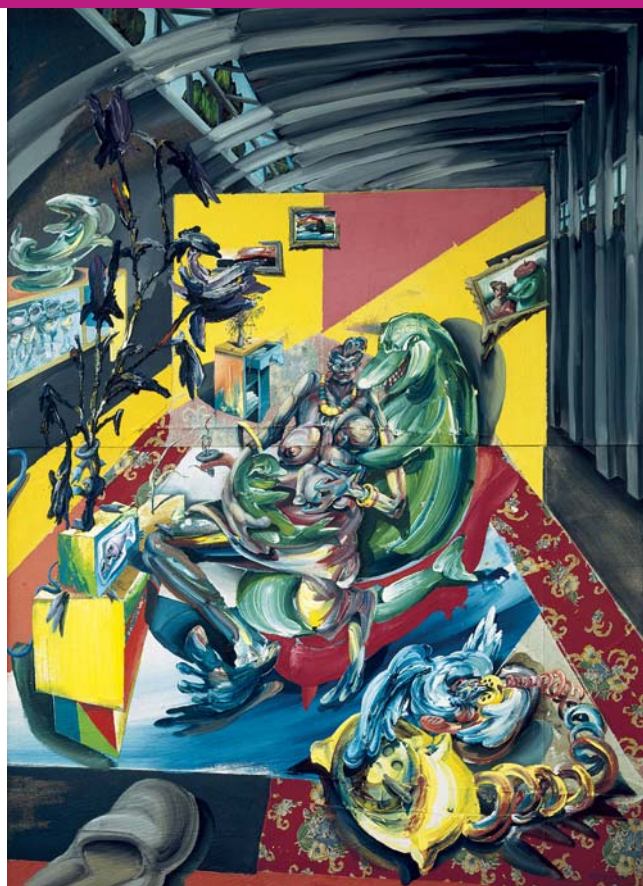
Smíšené manželství, 1987, olej, akryl, písek, textil, sololit, 240x180 cm

Na veřejnost vystupuje Michael Rittstein v roce 1972, tedy v polovině svého studia na Akademii výtvarných umění v Praze. Je člověk společenský a dovede s lidmi navázat plodný dialog. Proto také vystavuje rád. Do jeho obrazů se v podobě řešení prostorového plánu promítají jeho zkušenosti ze závodního plavání a života na pražských sídlištích.