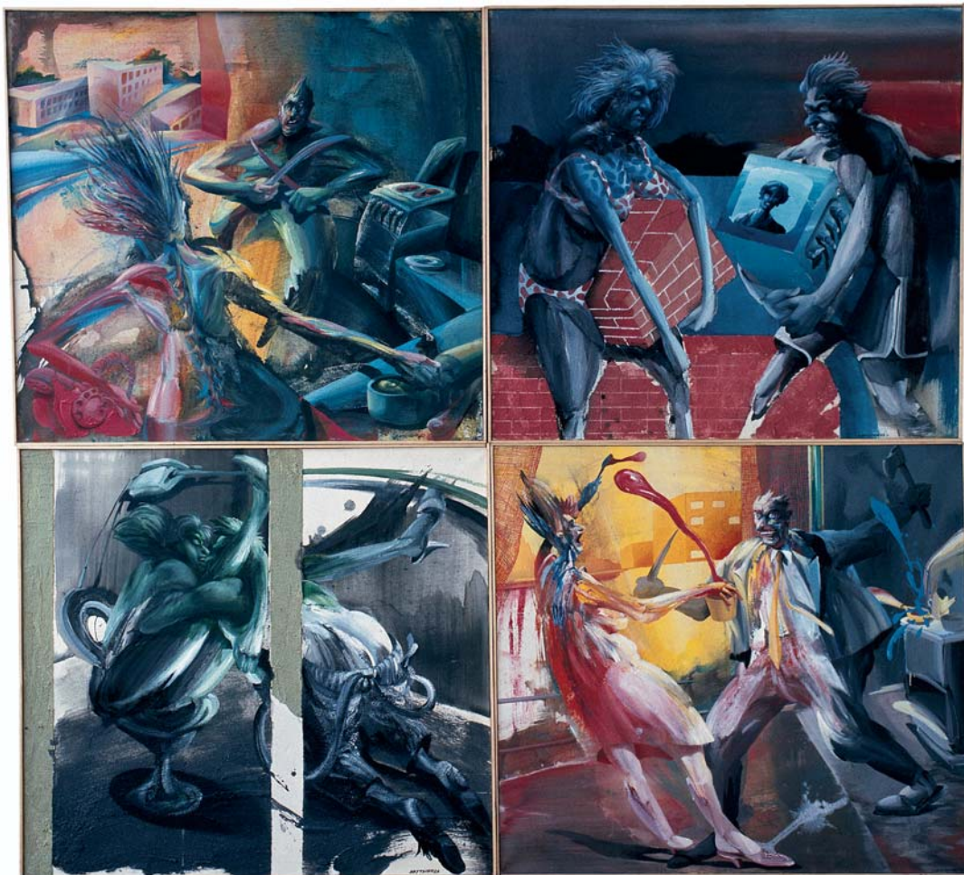
Lokální historka, 1983, akryl, olej, plátno, 200x250 cm