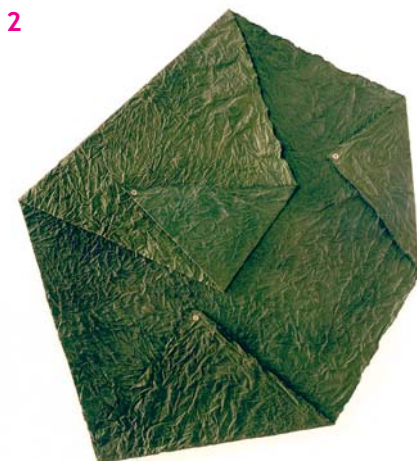
Bez názvu, 1976