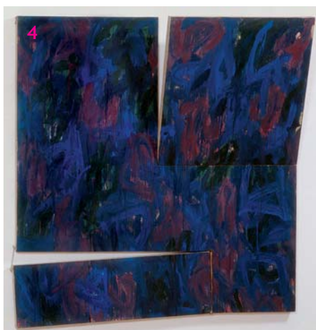
Dělené plochy II, 1981–83