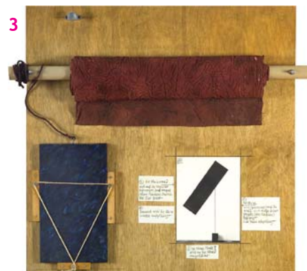
Bez názvu, konec 70. let