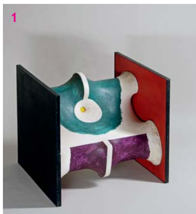
Předmět k otáčení se čtyřmi různými polohami, 1970

V evropském moderním umění se v šedesátých letech 20. století stírá hranice mezi obrazy, plastikami a objekty. Příkladem jsou nejen malířské plastiky Jana Kotíka, ale také díla italského umělce Emilia Vedovy (jeho dílo Krutá historie našeho času , 1969 naleznete ve stálé expozici zahraničního umění v 1. patře Veletržního paláce).