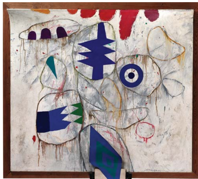
Plochy a tvary v prostoru, 1964

Vytvořte knihu, která bude složena z několika přeložených papírů, z nichž každý bude určitým způsobem poupraven (perforován, natrhán, vytržena jeho část apod.). Zkuste pracovat tak, aby se kniha dala „číst“ a jednotlivé stránky na sebe vizuálně navazovaly.