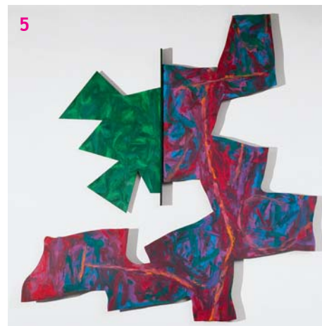
Bez názvu, 1989