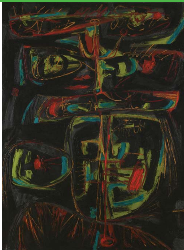
Hlava krále, 1959