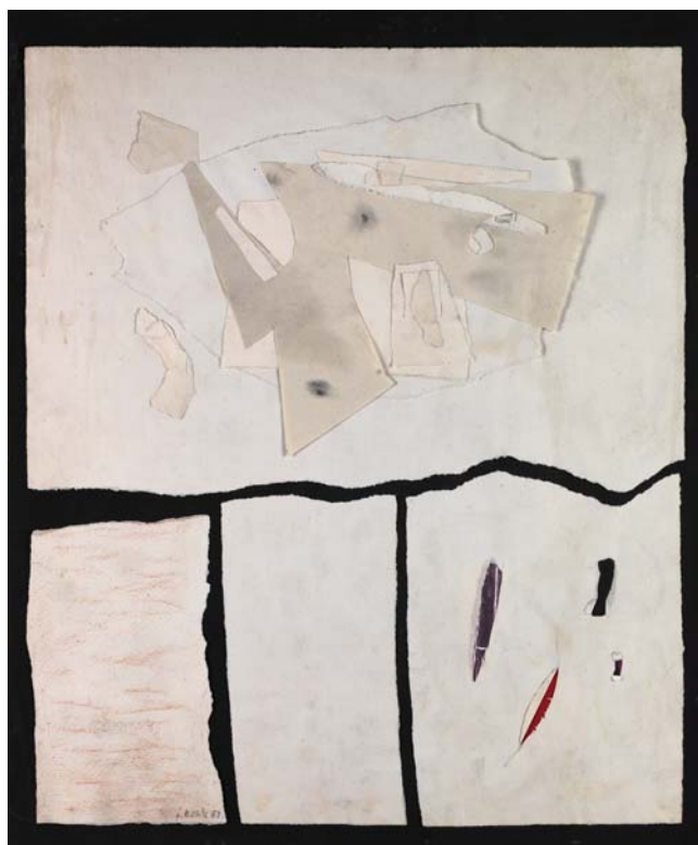
Bez názvu, 1963