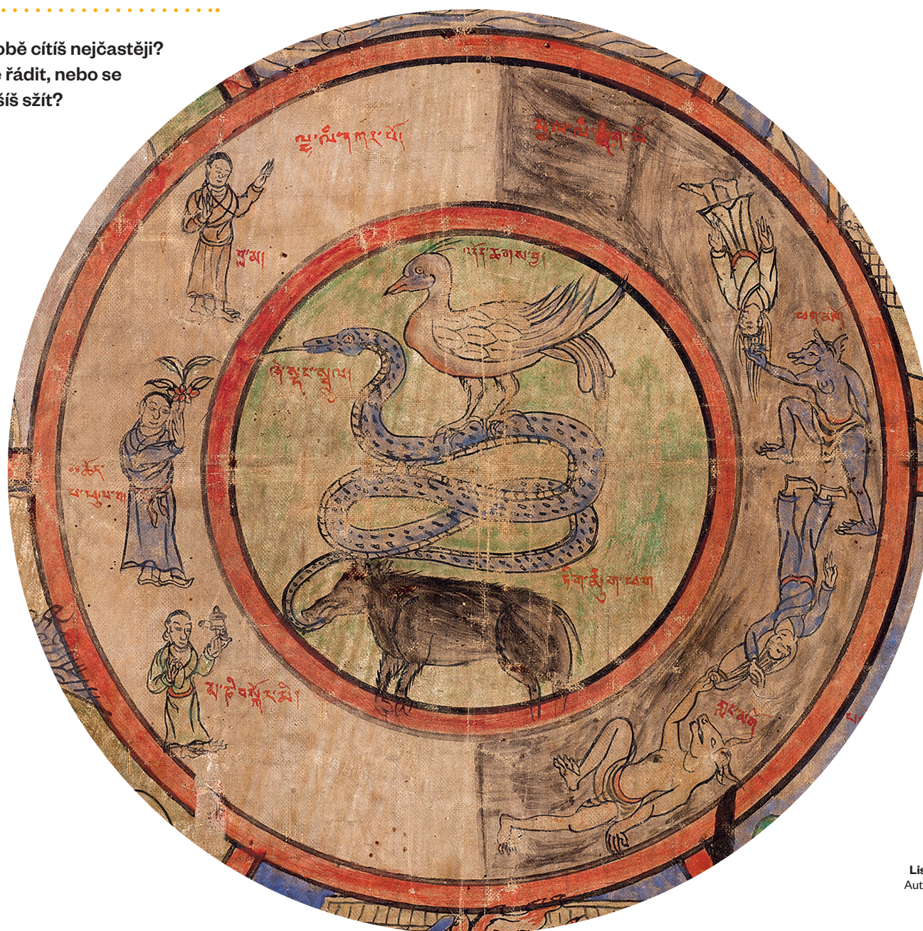
Bhavačakra (Kolo bytí) Mongolsko 19. století Národní galerie Praha (detail)

Zkus nakreslit co nejdokonalejší kruh – od ruky. Soustřeď se pouze na linku a na kroužení své ruky.