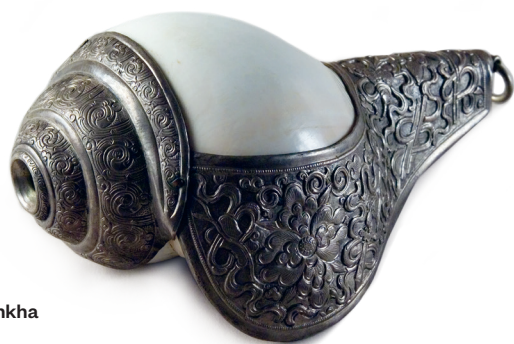
Bílá ulita šankha Tibet 18. století Národní galerie Praha

Jak asi vypadala před tím, než z ní lidé udělali obřadní hudební nástroj? Představu zkus nakreslit do prázdného místa. Ulita je z živočicha, který v Tibetu určitě nežije. Jedná se o schránku měkkýše z Indického oceánu. Můžeš dokreslit i prostředí, ve kterém tento živočich původně žil.